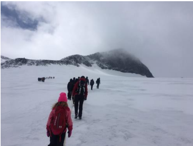
Framhevet bilde: Ophavsrettsbeskyttet

Basert på kun vitenskapelige artikler konkluderer kunstig intelligens at klimavariasjonene primært er naturlige. CO 2 -hypotesen beregnet med IPCCs modeller og deres justeringer av temperatur og solinnstråling taper 'kampen' mot naturlige variasjoner og originaldata. Grok 3 betas KI-analyse uten føringer viser at det kan utarbeides konsistente, vitenskapelige vurderinger når grunnlaget er vitenskapelige artikler. Det er ingen konsensus, og naturlige variasjoner dominerer konklusjonene. Men vil man påvirke resultatet er det bare, som med dagens beregningsmodeller, å styre programmet og prøve seg frem til man «lykkes».